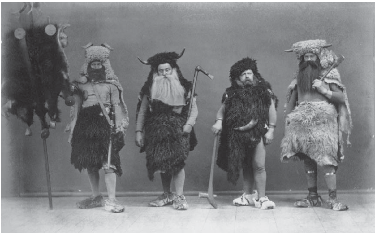
Abb. 5: ‚Pfählbauern‘ anlässlich des Neuenburger Schützenfestes 1882.

haben, einen Rollenwechsel, ein Spiel mit einer anderen – wenn auch nicht verkehrten, so doch vergangenen – Welt und bietet einen Raum für soziale Interaktionen. Dass der Karneval ursprünglich apotropäischen Charakter hatte, soll nicht verschwiegen werden; er spielt heute aber kaum noch eine Rolle, denn es geht vielfach nur noch um das ‚Event‘ bzw. um das Verkleiden und den damit einhergehenden Rollenwechsel. Die enge Verknüpfung von Karneval/Fasching mit ‚Living History‘ zeigt auch der Dokumentarfilm Die Stämme von Köln (2010) der Ethnologin Anja Dreschke. Zu den ‚Kölner Stämmen‘ gehören rund 80 Vereine aus Köln, deren Mitglieder sich u.a. als Hunnen, Mongolen, Tataren, Germanen, Ritter oder Indianer beiderlei Geschlechts verkleiden und einen Großteil ihrer Freizeit mit der Herstellung von Kostümen, Waffen etc. verbringen. Sie agieren eben nicht nur während des Karnevals, sondern auch in den Sommermonaten (zum Film siehe auch Holtorf 2012). 24 Es scheint mir daher in Anlehnung an