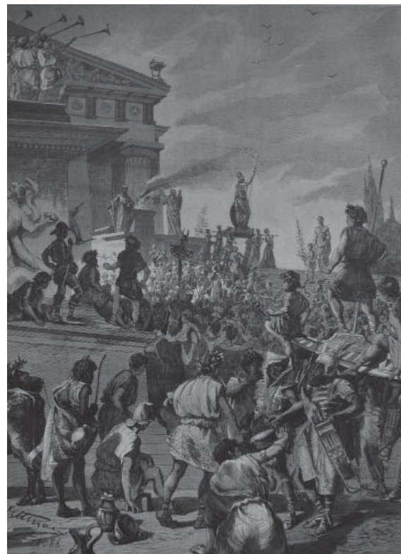
Abb. 4: ‚Griechisches Fest‘ auf der Jubiläums-Kunstaussstellung in Berlin 1886 ( Illustrierte Zeitung , 10. Juli 1886, Nr. 2245).

Als drittes ist der Karneval anzuführen, verstanden als „Maskierung und Rollenwechsel“, „Spiel mit der verkehrten Welt“ sowie als offener Raum „für das Ausleben von Geselligkeit“ (Braun 2002: 7). Auch die kostümierte Zeitreise evoziert, wie wir gesehen