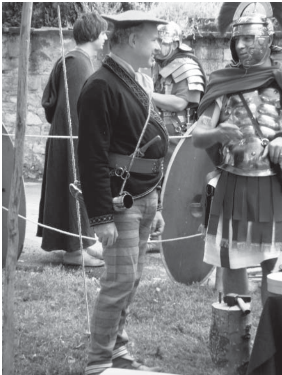
Abb. 1: Akteure auf dem ‚Römerfest‘ in Rottenburg a. N. 2011.

Zum wichtigsten Mittel zählt die Verkleidung (Abb. 1). Mit dem Ablegen der zeitgenössischen bzw. Alltagskleidung und dem Anlegen eines Kostüms wird einerseits „Geschichte am eigenen Leib erfahren“ (Fenske 2009: 83). Andererseits wird auch rein optisch ein Rollen- und damit in gewisser Hinsicht auch ein Identitätswechsel vorgenommen, nach dem Motto ‚Bankangestellter war ich vorhin, jetzt bin ich ein römischer Legionär des 1. Jahrhunderts n. Chr.‘. Die Kleidung und weitere Ausrüstungsgegenstände – in diesem Falle z. B. Tunika, Helm ( galea ), Kettenhemd ( lorica hamata ), Sandalen ( caligae ) und Kurzsword ( gladius ) – markieren nicht nur für den Darsteller selbst, sondern auch für das Publikum eine Art ‚Zeitsprung‘ – der materiellen Kultur kommt also eine entscheidende Rolle bei der Zeitwahrnehmung zu. Gleiches gilt auch für weiblichen Rollentausch. Die materielle Kultur ist es, die bei Akteuren und Zuschauern das ‚Eintauchen‘ in eine andere Epoche und die Vorstellung von ‚erst‘ und ‚jetzt‘ erleichtert. Durch die zumeist originalgetreu hergestellte Kleidung und Ausrüstung soll zugleich Authentizität hergestellt werden. 14 Sie ist ein entscheidendes