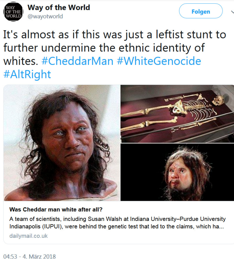
Abb. 2. Twitterbeitrag von Way of the World vom 4.03.2018 zum Cheddar Man .